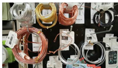
Ståltråd brukes inne i statuen