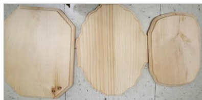
Trestykker som skal settes under skulpturere