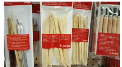
Verktøy for skulptur