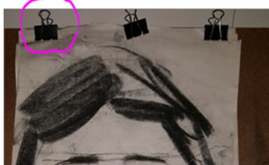
Klemme for å få papiret på brettet.