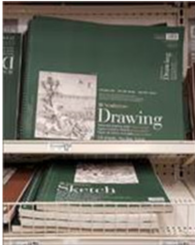
Eksempler på tegneblokker