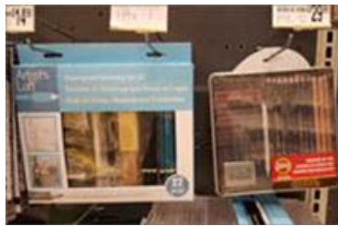
Ulike eksempler på kull og blyant