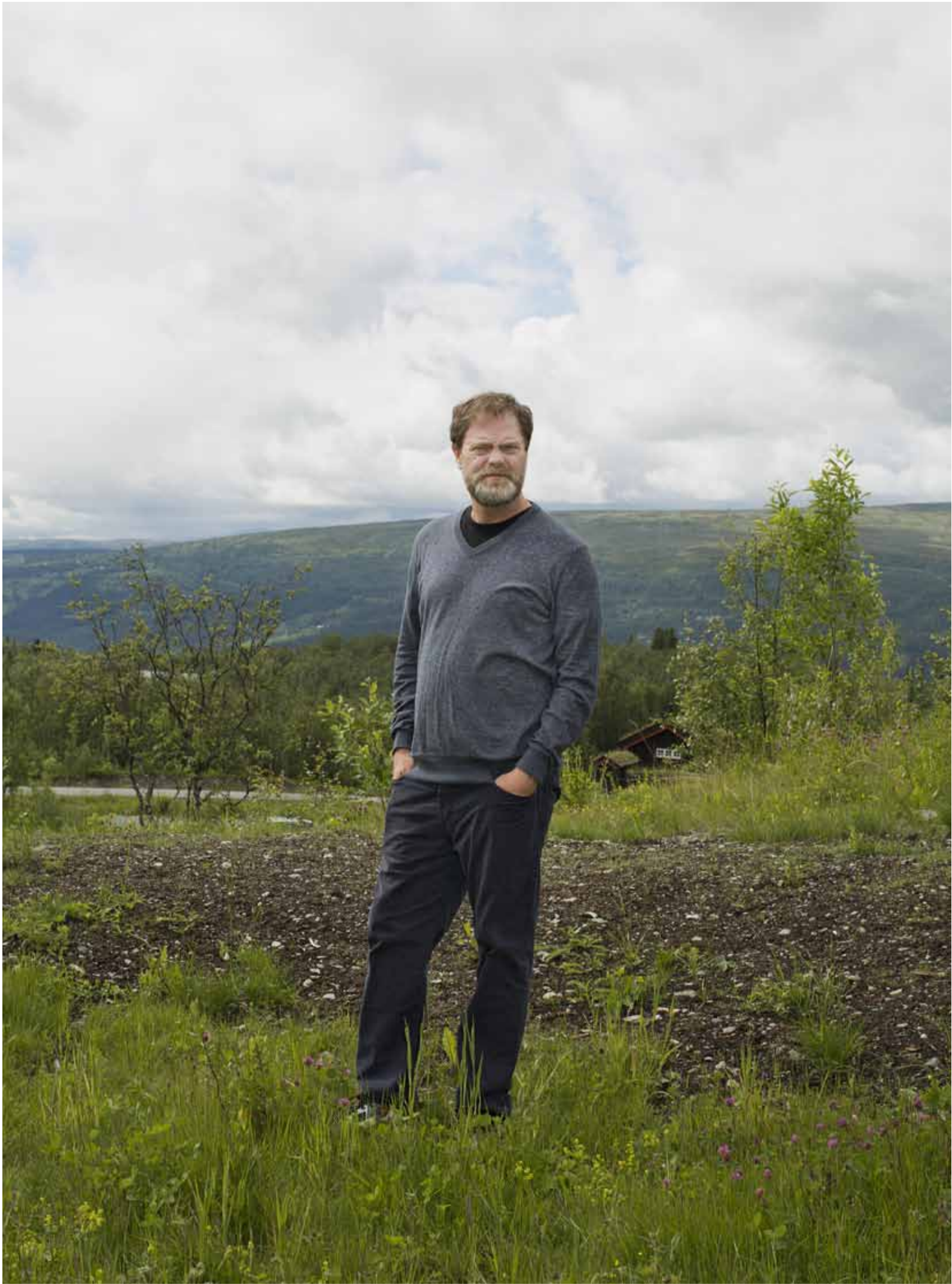
FOR BAHIER I NORGE

Religionens moderne ansikt? Rainn Wilson gjenfant bahai etter noen turbulente tyveår. Han mener verdens politiske systemer er ødelagte, og vil sette i gang «en spirituell revolusjon». Han har startet nettmediet SoulPancake, som publiserer «inspirerende innhold» i sosiale medier: – Utdfordringen har vært at internett ikke er stedet hvor folk ønsker å ta slike diskusjoner.